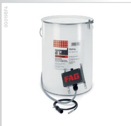
Einsetzbar für FAG Arcanol-Fette und nach Kalibrierung auch für weitere Fette