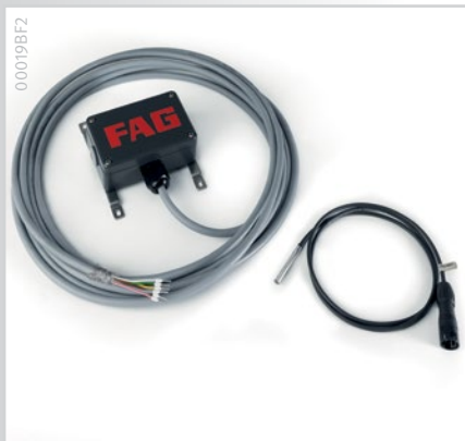
Auswertelektronik und Fettsensor